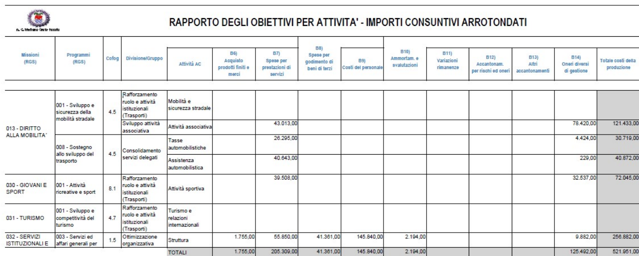
Tabella 6.4.2 – Piano obiettivi per progetti