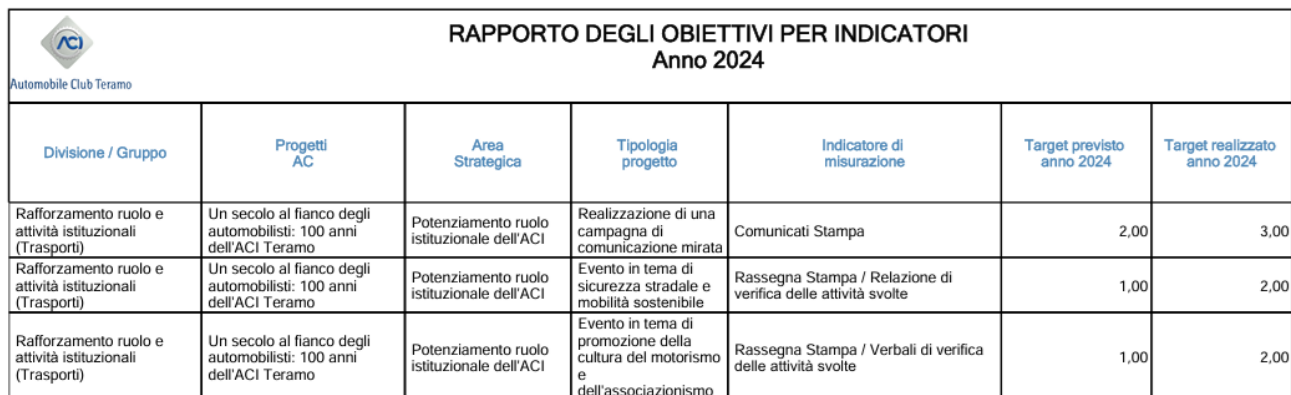
Tabella 4.5.3 – Piano obiettivi per indicatori

Il progetto “Un secolo al fianco degli automobilisti: 100 anni dell’ACI Teramo” ci ha visti impegnati anche tramite la diffusione dell’evento con rassegne stampa e l’utilizzo dei nostri canali social di Instagram e Facebook per pubblicizzare i vari eventi tenutosi nel corso del corrente anno.