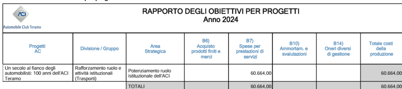
Tabella 4.5.2 – Piano obiettivi per progetti

Il progetto abbraccia il tema del centenario dell'Automobile Club Teramo e si è sviluppato attraverso l'organizzazione di una serie di eventi culturali, sportivi e istituzionali, che hanno sottolineato il contributo dell'ACI alla crescita della comunità locale e alla promozione del mondo automobilistico. Il progetto ha coinvolto diverse istituzioni, enti locali e migliaia di soci, che hanno partecipato attivamente alle manifestazioni organizzate. Gli eventi, distribuiti lungo tutto il 2024, hanno riscosso grande successo di pubblico e hanno rappresentato un importante momento di condivisione e riflessione sul passato e sul futuro