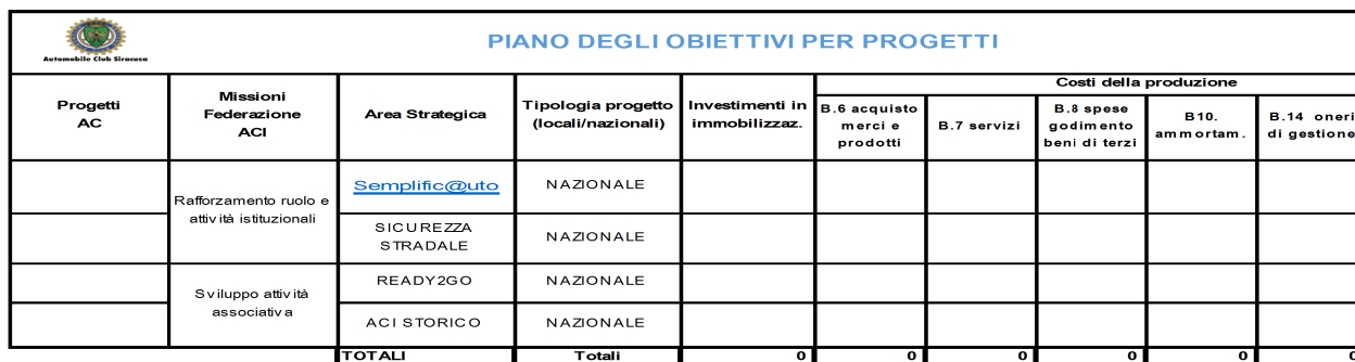
Tabella 4.5.2 – Piano obiettivi per progetti

La tabella Piano obiettivi per progetti mostra che l'Automobile Club Siracusa non ha attivato, nel corso dell'esercizio 2017, progettualità locali ulteriori rispetto a quelle affidate dalla sede centrale ACI. Per quanto riguarda i costi relativi a tali attività progettuali si specifica che le attività rientranti nella priorità politica istituzionale non generano costi