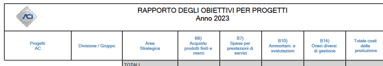
Tabella 4.4.3 – Piano obiettivi per indicatori