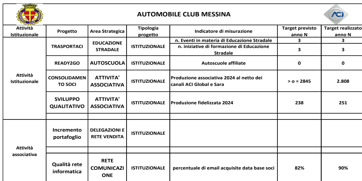
Tabella 4.4.3 – Piano obiettivi per indicatori

L'AC non ha sostenuto costi per le attività progettuali istituzionali né dispone di attività progettuali locali.