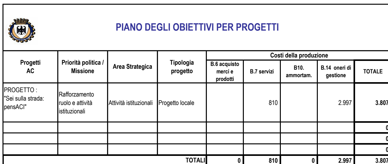
Tabella 4.4.4 – Piano obiettivi per indicatori