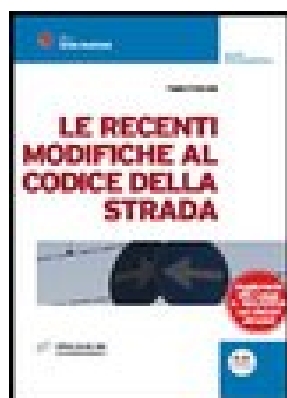
LE RECENTI MODIFICHE AL CODICE DELLA STRADA di Piccioni Fabio – 2006 Editore Expert