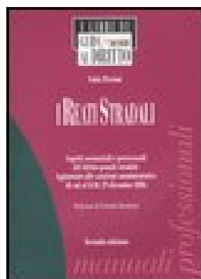
I REATI STRADALI . ASPETTI SOSTANZIALI E PROCESSUALI DEL DIRITTO PENALE STRADALE di Piccioni Fabio – 2007 Editore Il Sole 24ORE Pirola