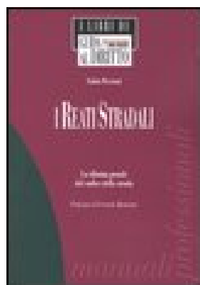
I REATI STRADALI. LA RIFORMA PENALE DEL CODICE DELLA STRADA di Piccioni Fabio – 2004 Editore Il Sole 24ORE Pirola