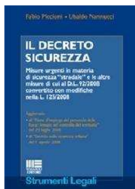
IL DECRETO SICUREZZA di Piccioni Fabio, Nannucci Ubaldo – 2008 Maggioli Editore