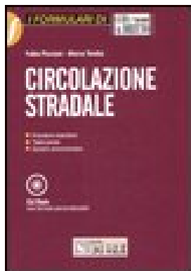
CIRCOLAZIONE STRADALE. CON CD-ROM di Piccioni Fabio, Tomba Marco – 2008 Editore Il Sole 24ORE Pirola