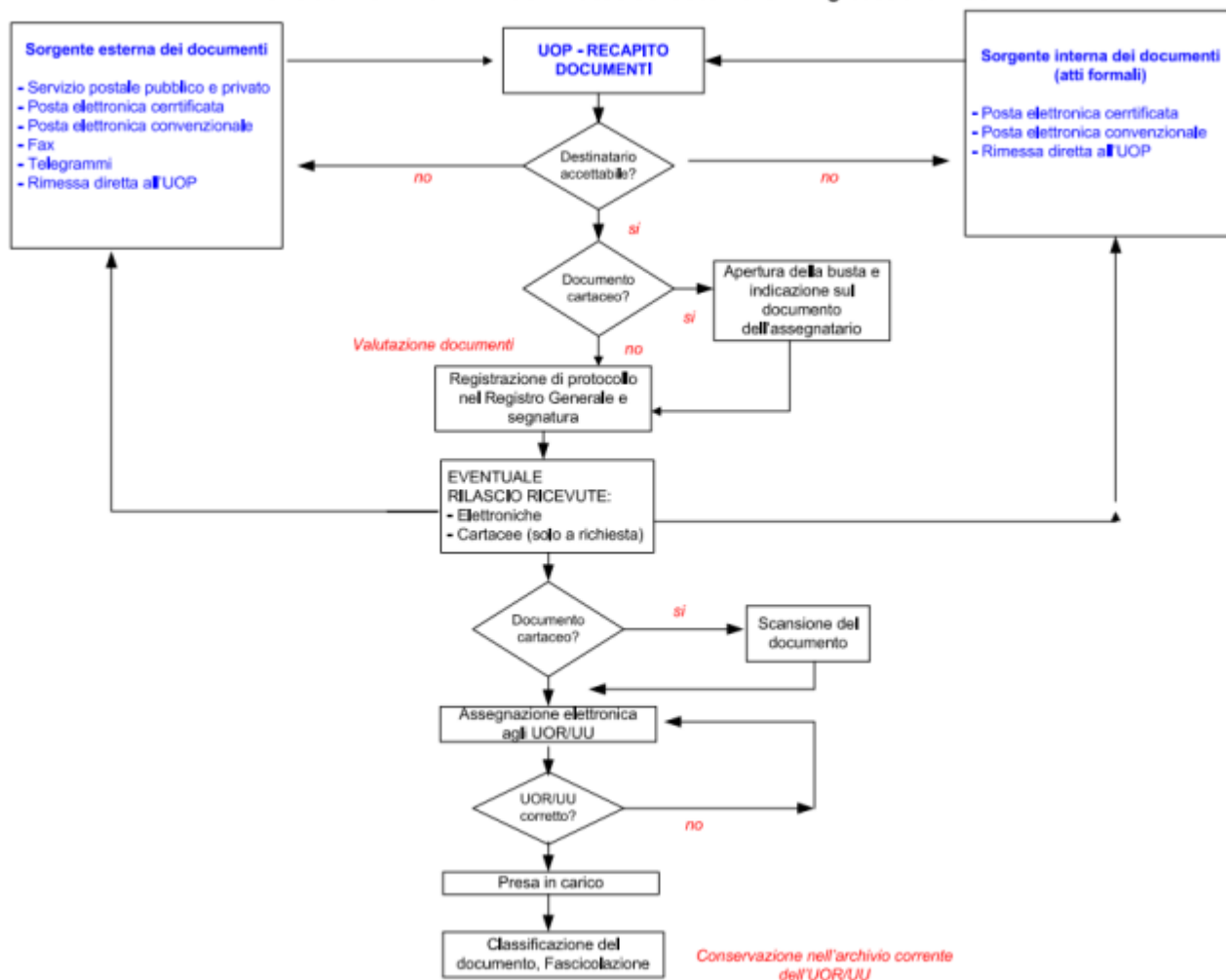
PROTOCOLLO INFORMATICO - Flusso dei documenti in ingresso alla AOO